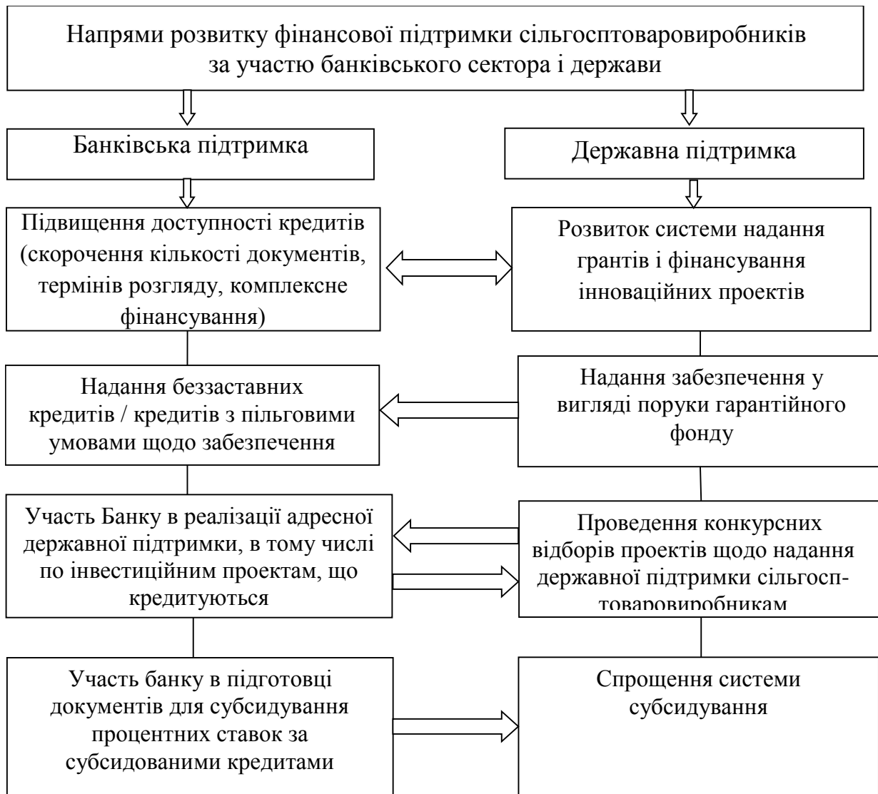
Рис. 3. Напрями розвитку фінансової підтримки сільгосптоваровиробників за участю банківського сектора і держави

Запропонована нами схема (рис. 3) дозволить всебічно забезпечити сільськогосподарські підприємства заходами державної та банківської підтримки для організації безперервного виробничого процесу і розширення