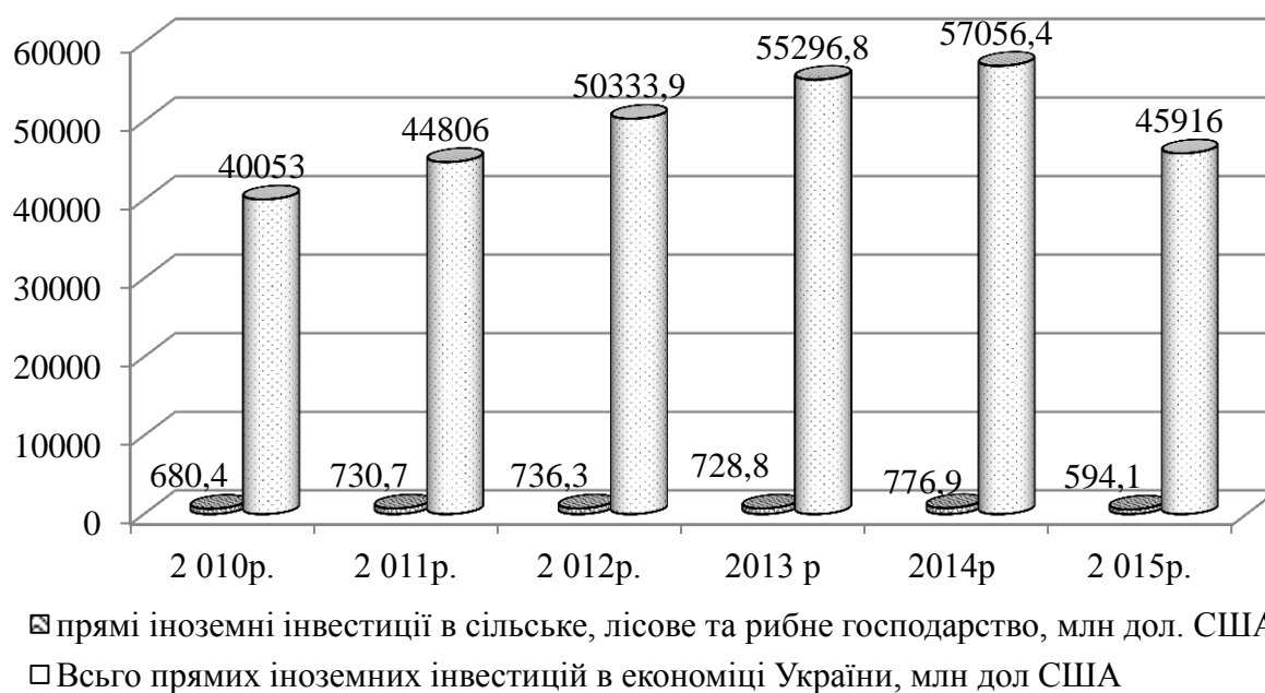
Рис. 2. Обсяги прямих іноземних інвестицій в економіку України та сільське, лісове та рибне господарство на початок року[6]

Прямі іноземні інвестиції (рис. 2) є одним із важливих аспектів інвестування при визначенні доцільності його реалізації. Аналіз динаміки обсягів прямого іноземного інвестування в Україну має тенденції до зростання з 40 053 млн дол США у 2010 р. до 57 056,4 млн дол США в 2014 р і відповідно в сільське, лісове та рибне господарство – з 680,4 млн дол США до 776,9 млн дол США. Проте на початок 2015 р. ситуація погіршилася і прямі іноземні інвестиції зменшилися, в порівнянні з 2014 р. на 11 140,4 млн дол США в економіку України і на 182,8 млн дол США в сільське, лісове та рибне господарство, що пов'язано з ситуацією, яка склалася в країні. Це свідчить про те, що сільськогосподарське виробництво є непривабливим для іноземного інвестування через відсутність гарантій прав власності на землю як основний сільськогосподарський актив та нестійкістю державних гарантій (дотацій) підтримки національних виробників.